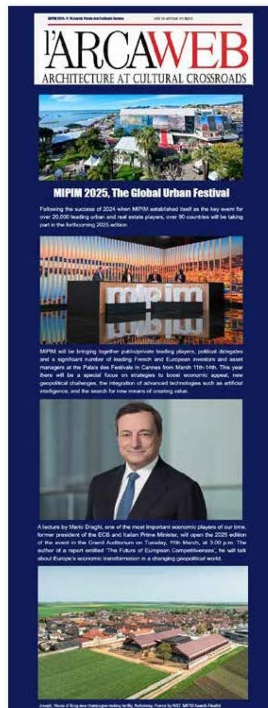
Immagine Jpg in formato verticale 700x900 pixel completa di tutte le informazioni e indicazione dell'indirizzo web da inserire sul link