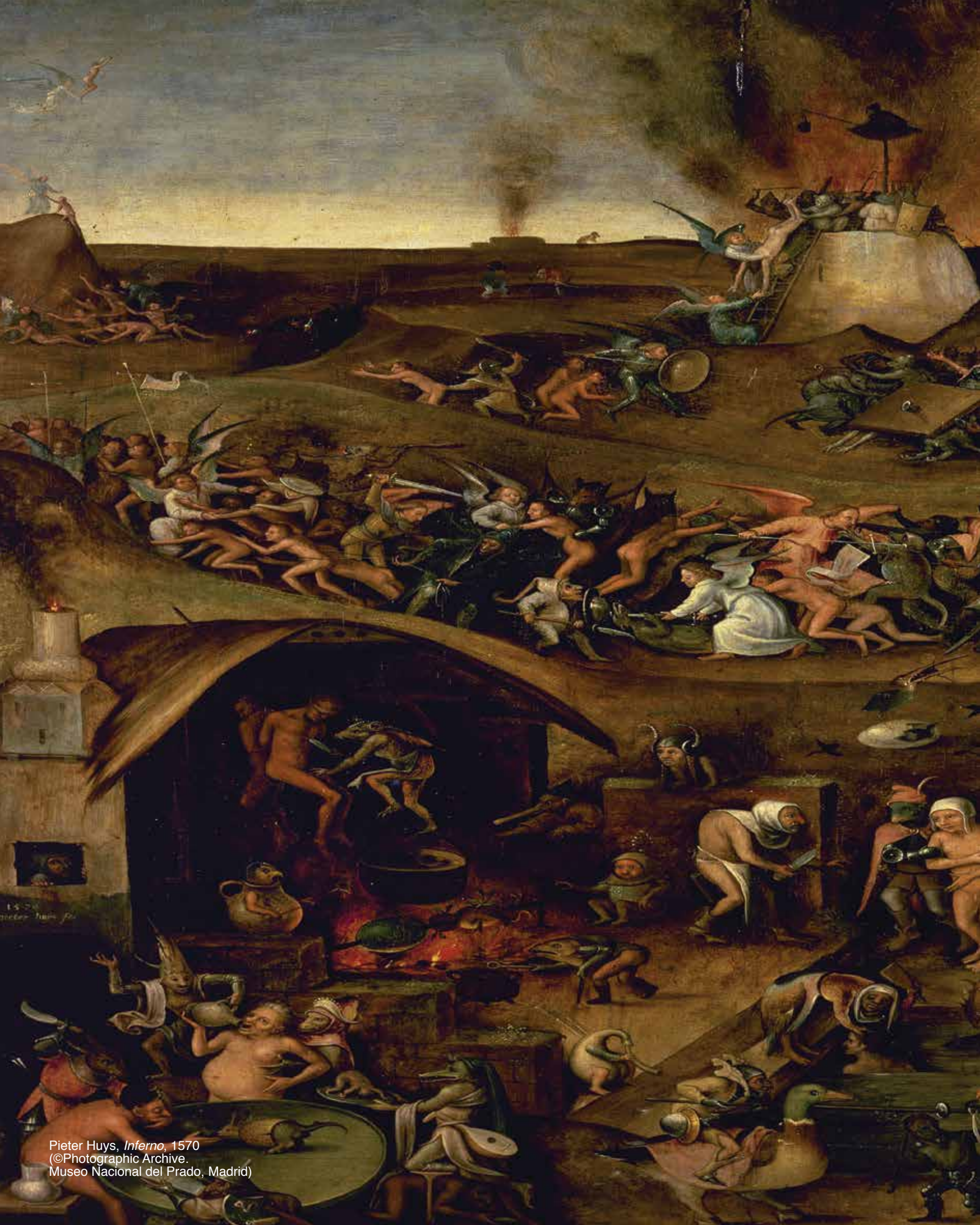
Pieter Huys, Inferno , 1570