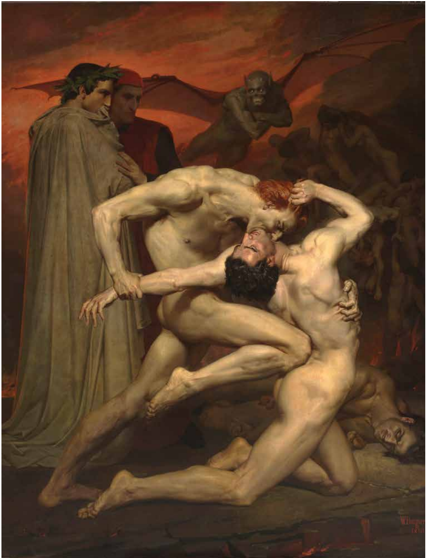
William Adolphe Bouguereau, Dante e Virgilio, 1850 (Parigi, Musée d'Orsay, acquis par don en 2010,)